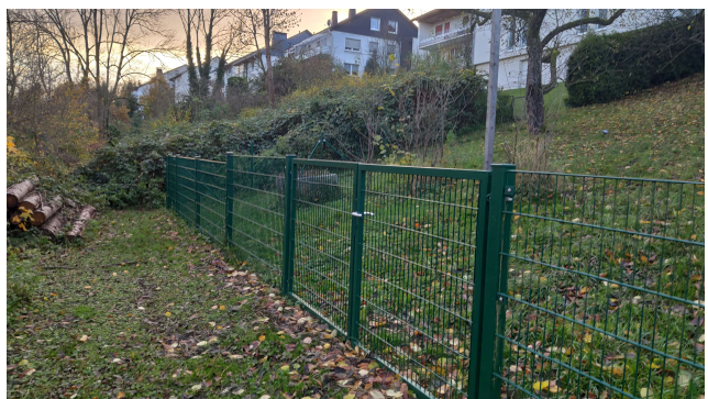
Bild 3: Grimmestraße, Höhe Flurstück 334, Richtung Süden