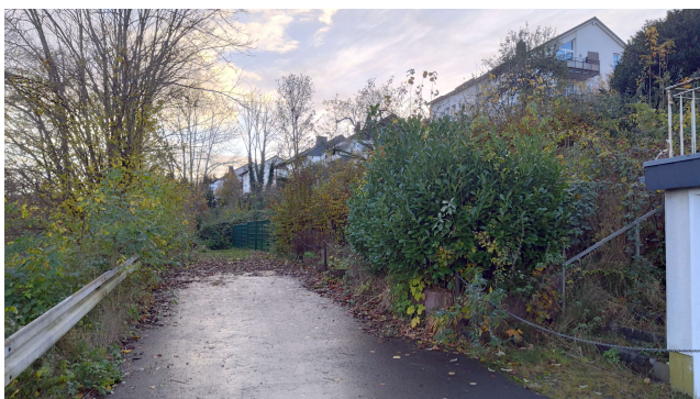
Bild 2: Grimmestraße, Höhe Haus Nr. 21, Richtung Süden